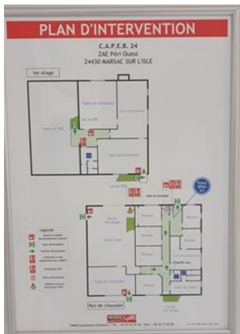
Plan d'évacuation RDC